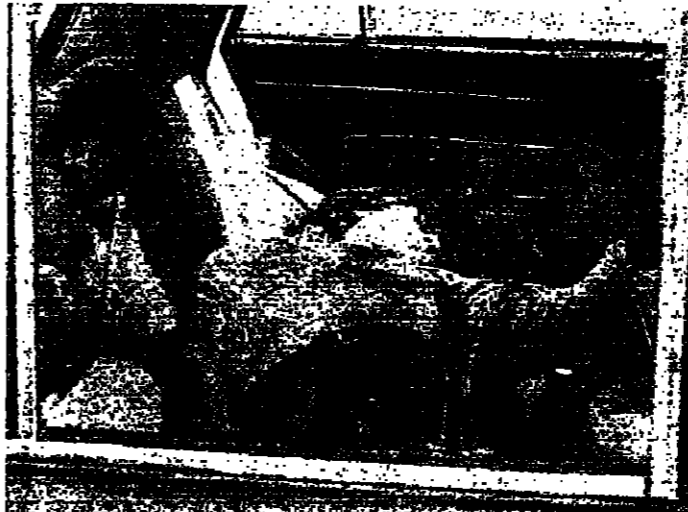
القتل كما بدأ في سيارته

سيارة القتل في مكان الحادث - سيارته على يد ابي نسي سيارته